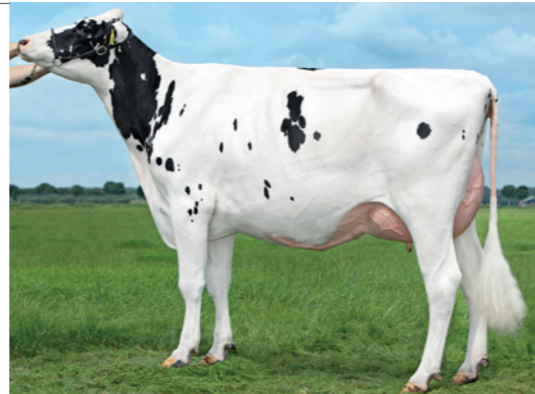
Gigaball Glasses V: Gigaball